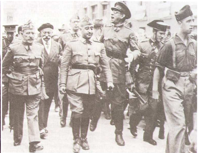
Los generales Franco, Mola y Cavalcanti en Burgos