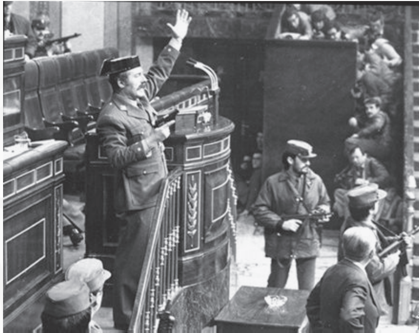
23 de febrero de 1981. Tejero en el Parlamento