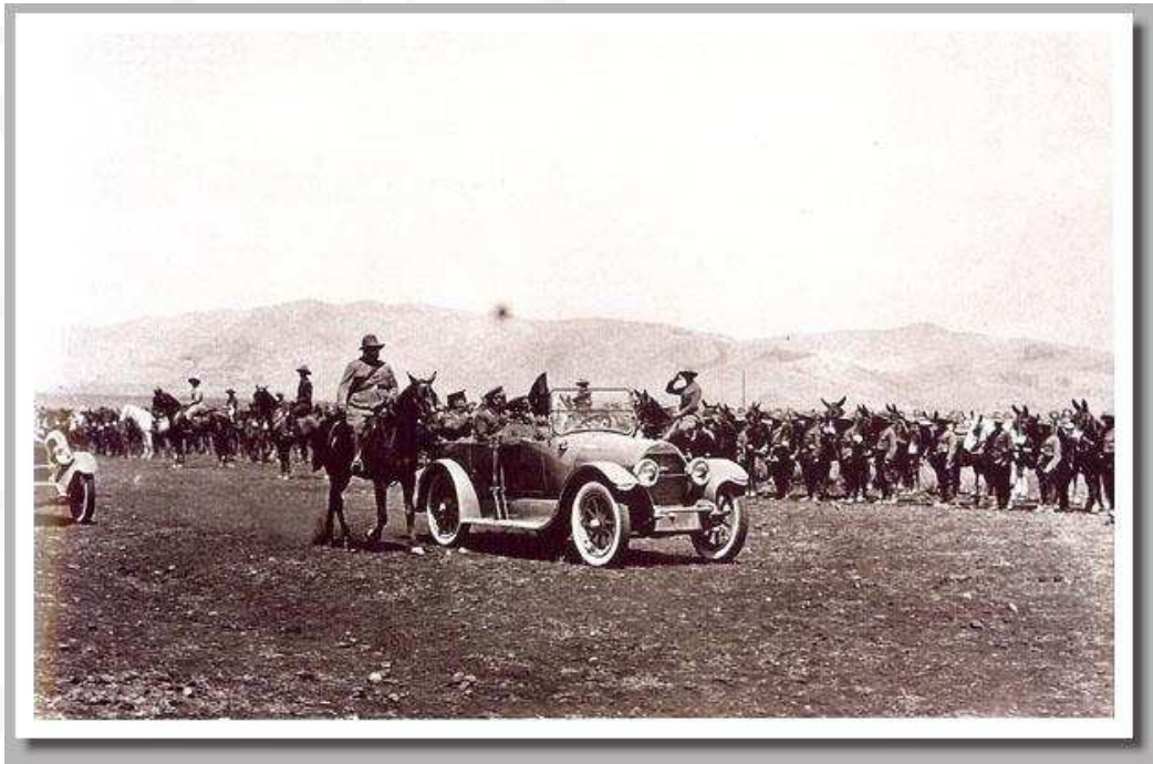
Parada militar con Primo de Rivera y Sanjurjo tras la victoria de Alhucemas en 1925.