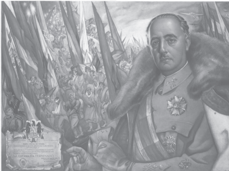
Francisco Franco, Generalísimo de los Ejércitos y Caudillo de España. Alegoría de la Victoria