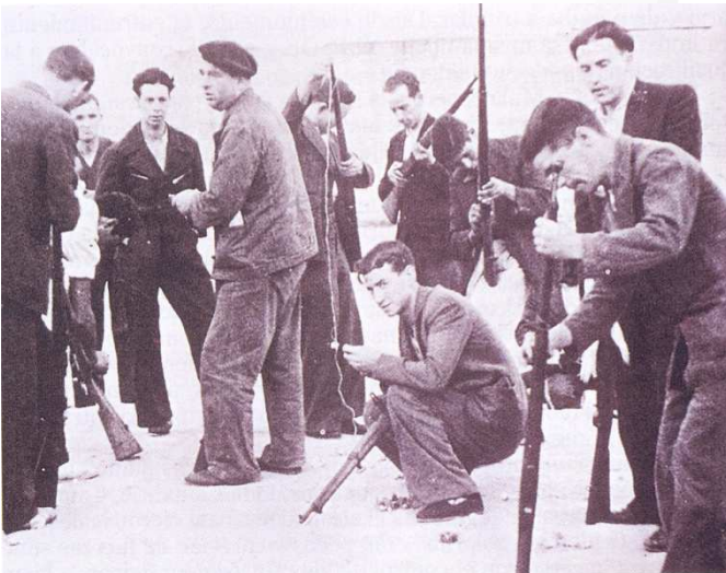
Entrega de fusiles a la población de Madrid por el gobierno de la República, 18 de julio de 1936