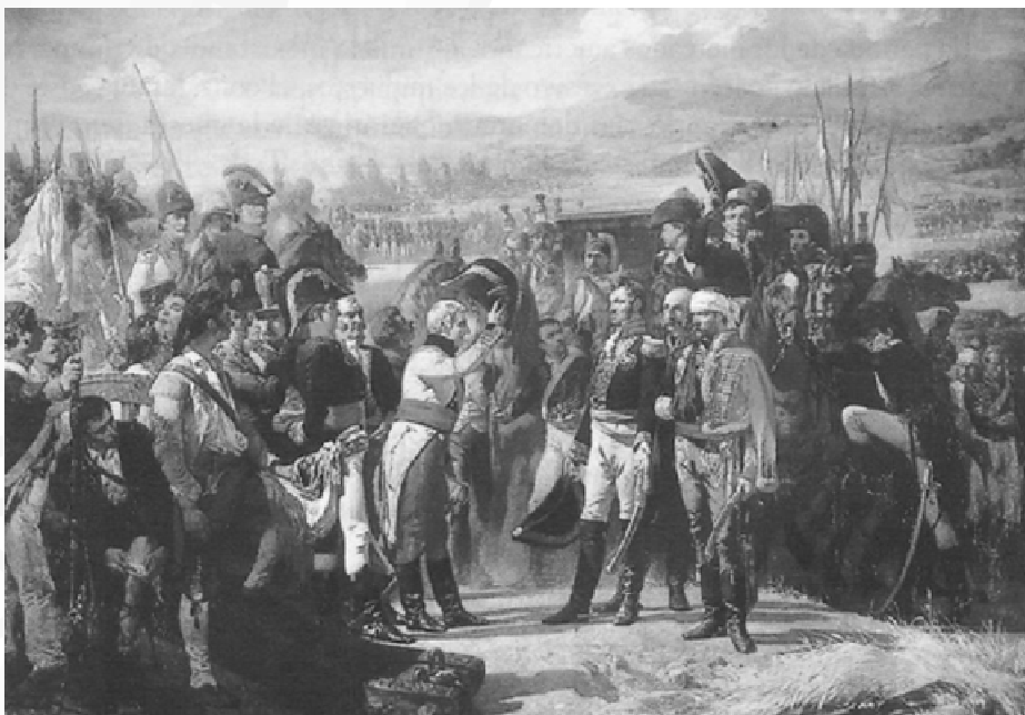
La rendición de Bailén, de Casado del Alisal