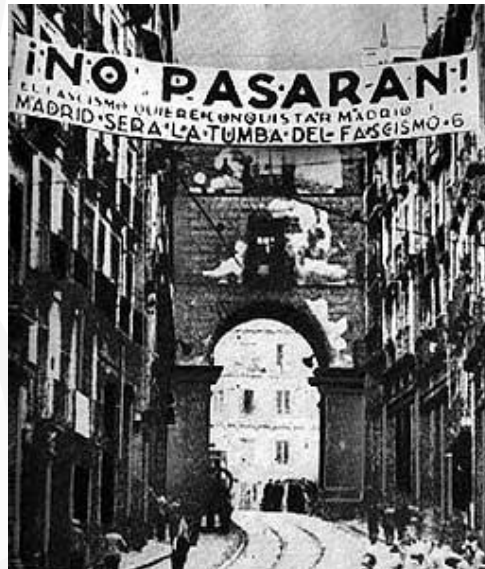
Sitio de Madrid durante la Guerra Civil