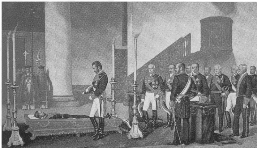
Amadeo I ante el cadáver de Prim (Obra de Antonio Gisbert, 1879)