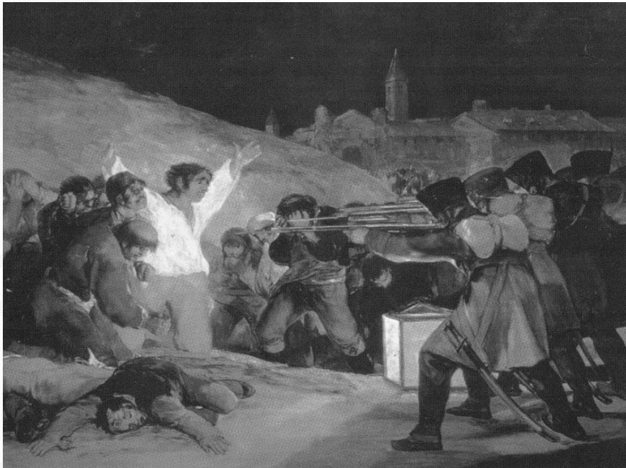
Francisco de Goya, Los fusilamientos (Museo del Prado)