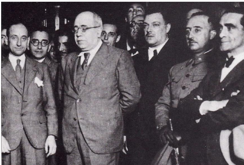
Manuel Azaña recibe un homenaje en la Coruña. A su izquierda, en un discreto segundo plano, el general Franco