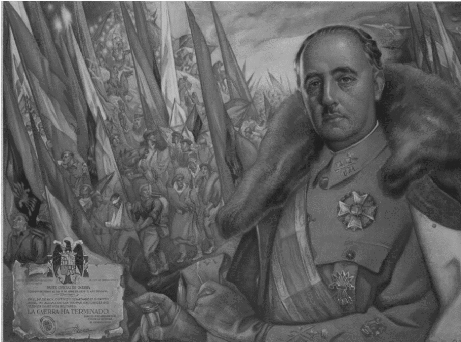
Francisco Franco, Generalísimo de los Ejércitos y Caudillo de España. Alegoría de la Victoria