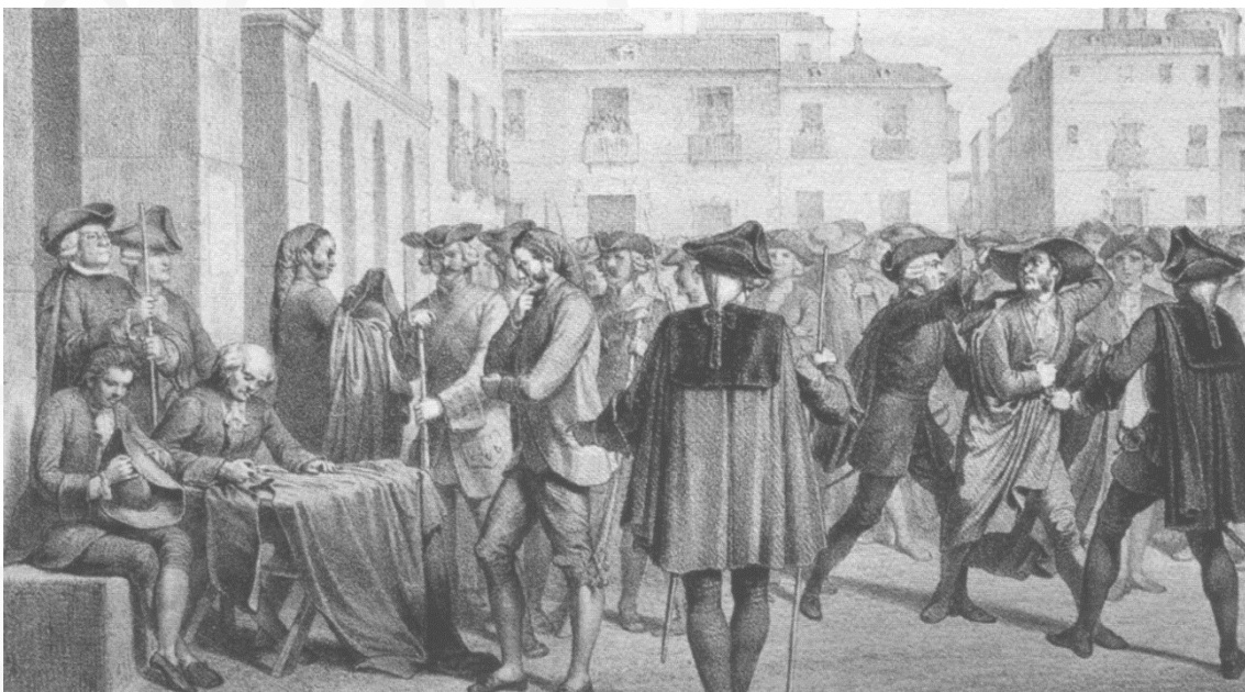
El motín de Esquilache, 1766