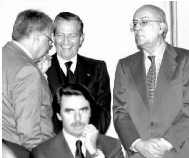
Presidentes del gobierno (1976-2004)